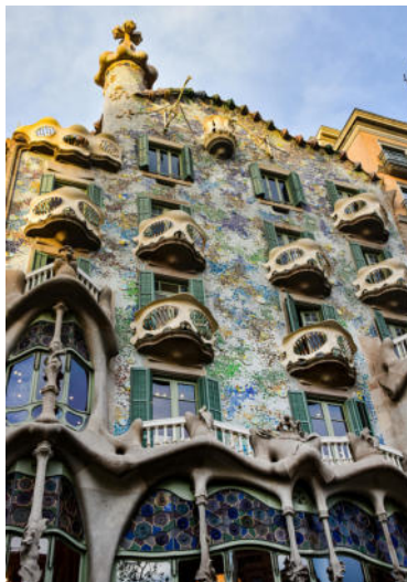
TRIANGOLO D'ORO PARTENZA DA BARCELLONA